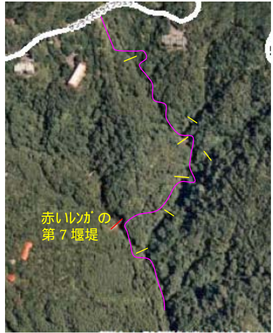
Google Map より山頂付近